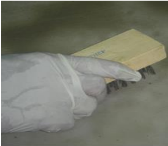
Vệ sinh bề mặt