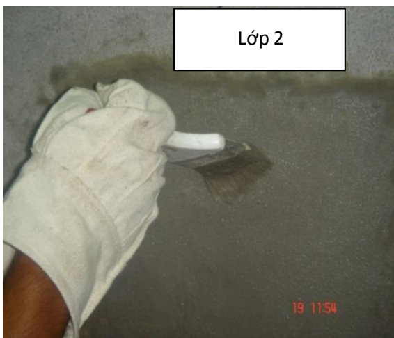
Thi công lớp thứ hai