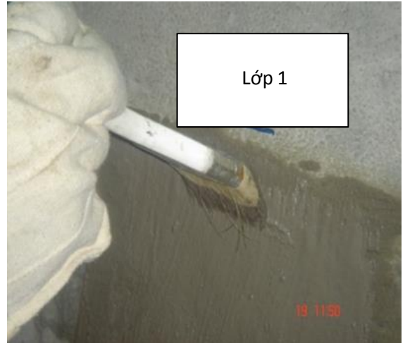
Thi công lớp thứ nhất