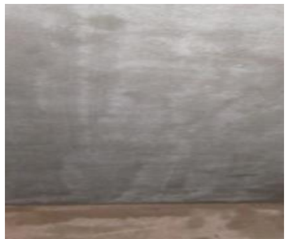
Bề mặt hoàn thiện

Vui lòng tham khảo tài liệu kỹ thuật các sản phẩm liên quan để biết thêm chi tiết.